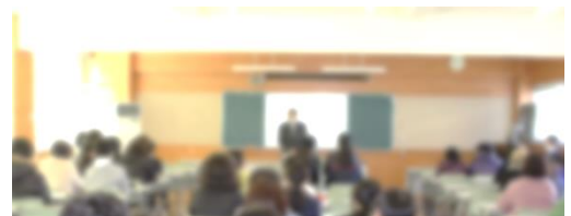
多くの皆さんにご参加いただきました。 (写真は加工したもの)

2月1日に、本年度3回目となる学校説明会を開催しました。1月4日の正午に申込を開始したところ、夕方には予定数に達する事態となり、現在申込を受け付けている第4回にも、既に80組150名を超える参加希望があることから、本校通信制への関心の高さが分かります。これも、在校生の皆さんの学ぶ姿勢が反映された結果であると喜ばしく思います。