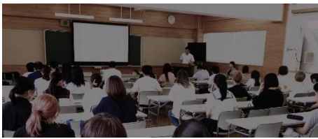
当日の様子 (写真は加工してあります)

7月2日(火)、 第1回学校説明会 を、本校大会議室にて実施しました。事前予約で限定した29組の参加者の皆さんは、通信制特有の学びのスタイルに関心を寄せながら、熱心に耳を傾けていました。