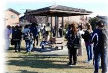
ウォークラリー(11月)